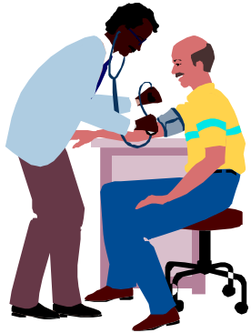
Un problème de santé caché